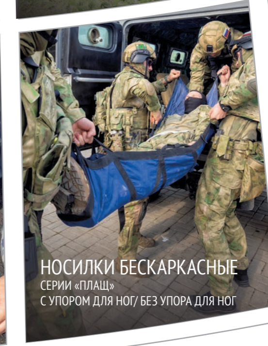
НОСИЛКИ БЕСКАРКАСНЫЕ СЕРИИ «ПЛАЩ» С УПОРОМ ДЛЯ НОГ/ БЕЗ УПОРА ДЛЯ НОГ