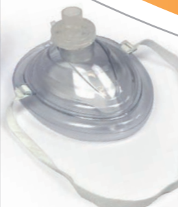
УСТРОЙСТВО ИСКУССТВЕННОГО ДЫХАНИЯ ТИПА «МАСКА-РОТ»