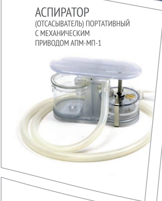
АСПИРАТОР (ОТСАСЫВАТЕЛЬ) ПОРТАТИВНЫЙ С МЕХАНИЧЕСКИМ ПРИВОДОМ АПМ-МП-1