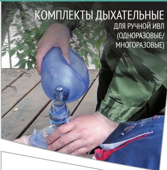
КОМПЛЕКТЫ ДЫХАТЕЛЬНЫЕ для ручной ИВЛ (ОДНОРАЗОВЫЕ/ МНОГОРАЗОВЫЕ)