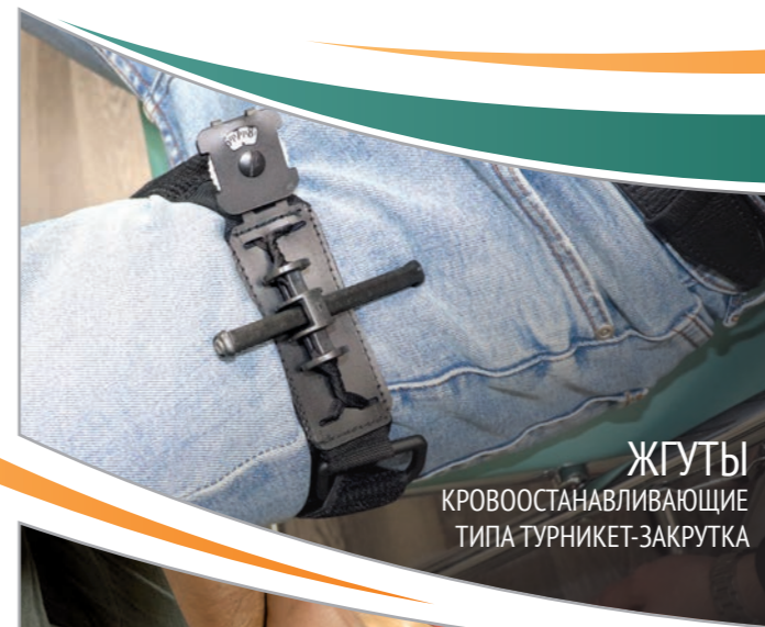
ЖГУТЫ КРОВООСТАНАВЛИВАЮЩИЕ ТИПА ТУРНИКЕТ-ЗАКРУТКА