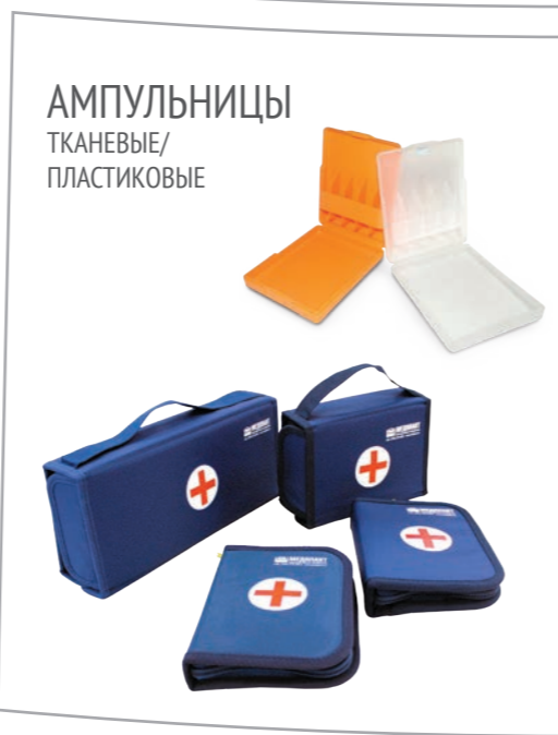
АМПУЛЬНИЦЫ ТКАНЕВЫЕ/ ПЛАСТИКОВЫЕ