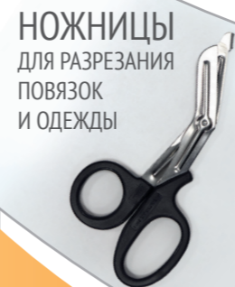
НОЖНИЦЫ ДЛЯ РАЗРЕЗАНИЯ ПОВЯЗОК И ОДЕЖДЫ