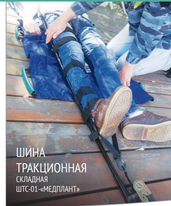
ШИНА ТРАКЦИОННАЯ складная ШТС-01-«МЕДПЛАНТ»