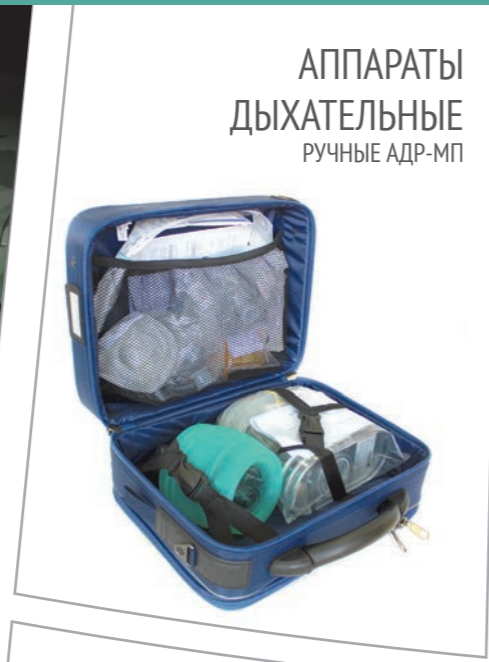
АППАРАТЫ ДЫХАТЕЛЬНЫЕ ручные АДР-МП