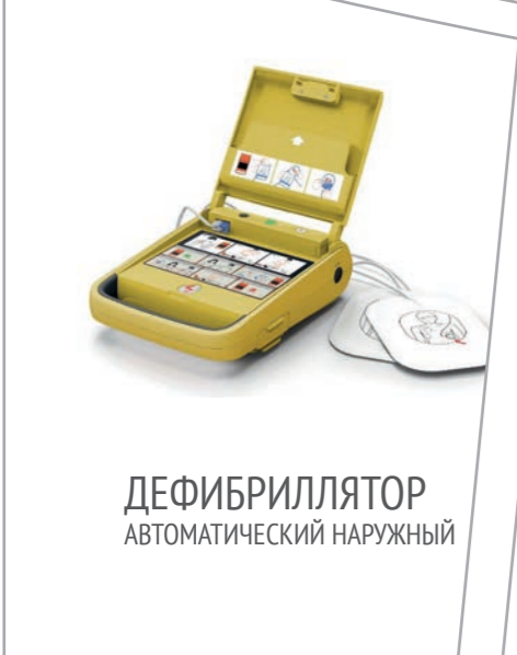
ДЕФИБРИЛЛЯТОР АВТОМАТИЧЕСКИЙ НАРУЖНЫЙ