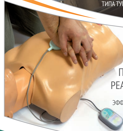
ПОМОЩНИК РЕАНИМАТОРА ИНДИКАТОР ЭФФЕКТИВНОСТИ СЛР «ТЕМП»