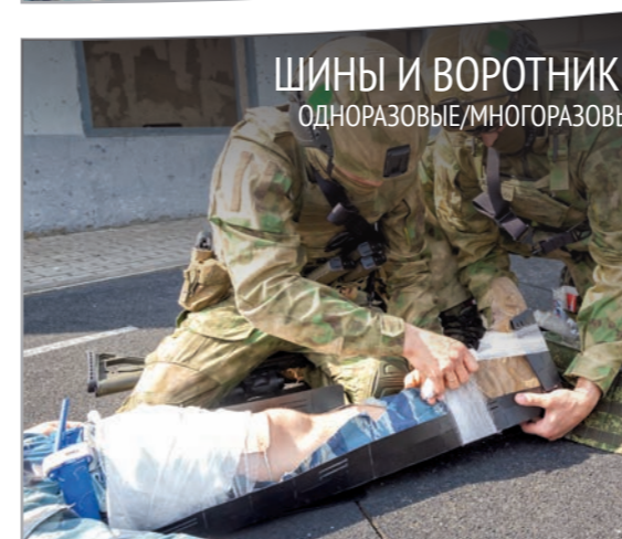
ШИНЫ И ВОРОТНИКИ ОДНОРАЗОВЫЕ/МНОГОРАЗОВЫЕ