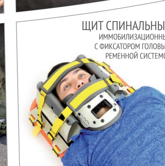
ЩИТ СПИНАЛЬНЫЙ ИММОБИЛИЗАЦИОННЫЙ с фиксатором головы и ременной системой