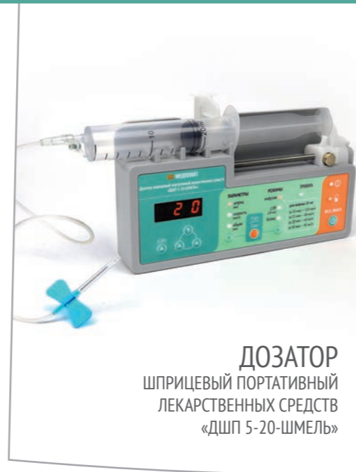
ДОЗАТОР шприцевый портативный лекарственных средств «ДШП 5-20-ШМЕЛЬ»