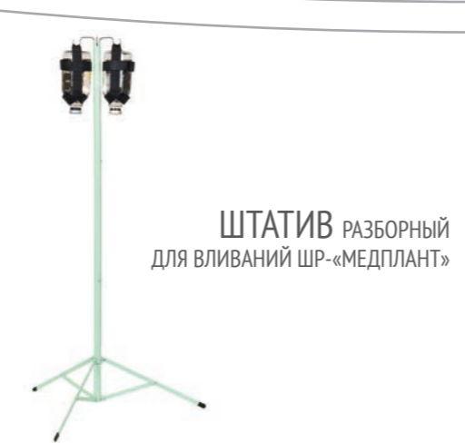
ШТАТИВ РАЗБОРНЫЙ для вливаний ШР-«МЕДПЛАНТ»