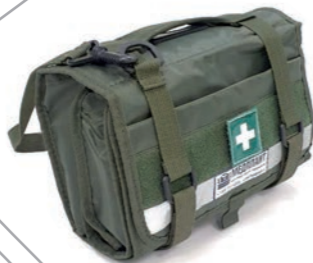
НПП (НАБОРЫ ПЕРВОЙ ПОМОЩИ)