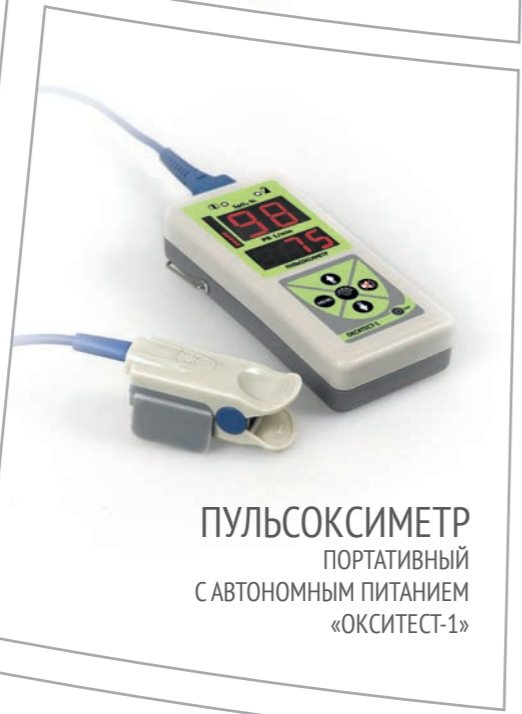
ПУЛЬСОКСИМЕТР ПОРТАТИВНЫЙ С АВТОНОМНЫМ ПИТАНИЕМ «ОКСИТЕСТ-1»