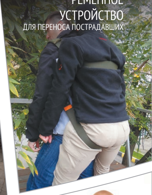
РЕМЕННОЕ УСТРОЙСТВО для переноса пострадавших