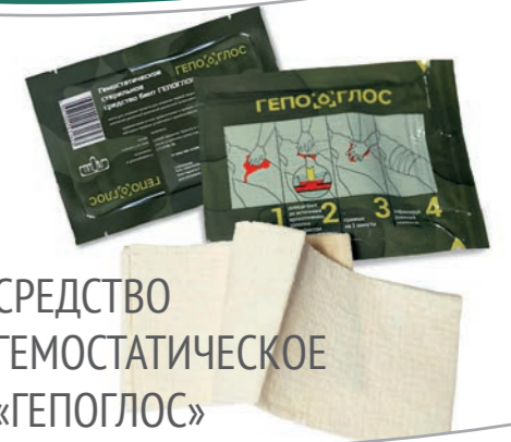
СРЕДСТВО ГЕМОСТАТИЧЕСКОЕ «ГЕПОГЛОС»