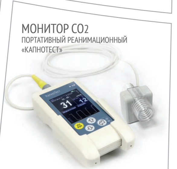
МОНИТОР CO2 ПОРТАТИВНЫЙ РЕАНИМАЦИОННЫЙ «КАПНОТЕСТ»